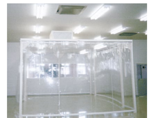
簡易クリーンブース

フィルターを通したクリーンエアを給気、 装置内を陽圧化して虫、異物の侵入を防ぎます。 エアタイト扉、装置内洗浄機能など、 ご要望に応じて設計・施工いたします。