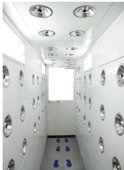
作業用エアシャワー